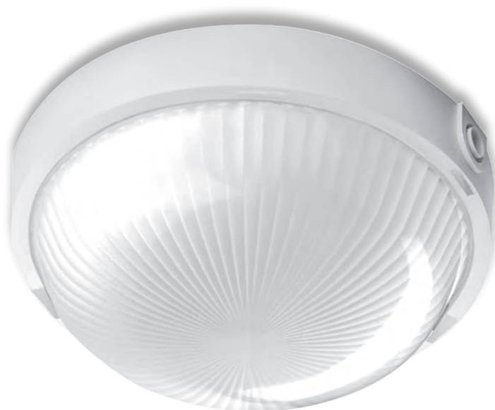
VEGA 1x100W OPAL